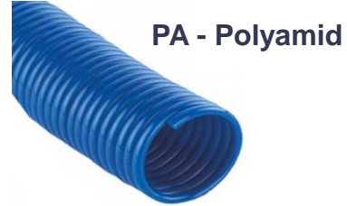
Kunststoffrohre aus Polyamid