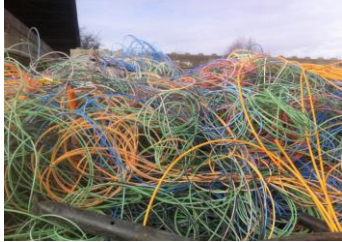
Schläuche & Rohre aus Mehrfachrohren

Folgende Beispiel-Fraktionen übernehmen wir nicht :