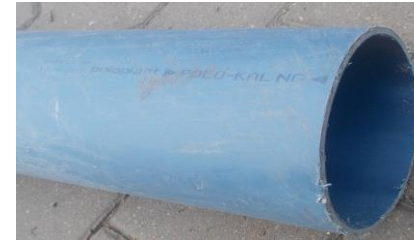
PP Rohre gefüllt