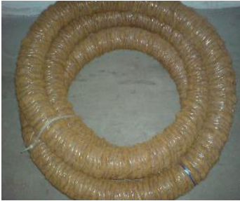
Drainagerohre mit Kokosummantelung