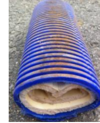
Rohre mit Dämmmaterial